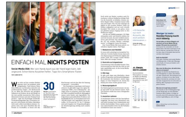
zukunft jetzt Ausgabe 2/2020, S.28 f.